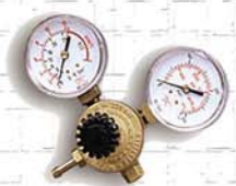
Manómetros (Não incluído)